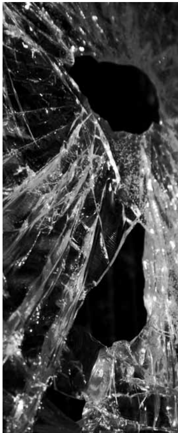
začnu Tě prosit, abys mě snědl, nechal umřít, přijal jako oběť jen už mě prosím nenechávej žít