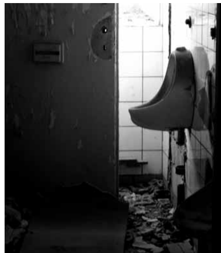
moje srdce se vyzvrací mezi pozvánky na pařby všeho druhu