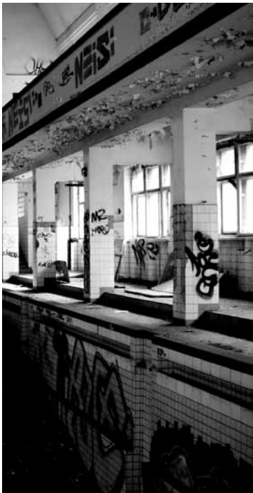
jelikož se na mě řítí celý ředitelství virtuálních komunikací plný řinčících telefonů a blikajících monitorů