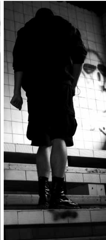
a já se rozhodnu umřít jinak a třeba i žít