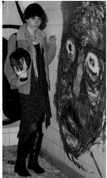
facebook se rozkročí nad mým polomrtvým tělem a zařve „oujé nechala jsem si ostříhat patku!“