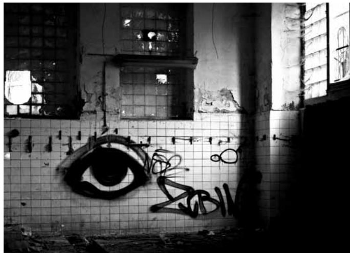
a tvoje ruka je nekonečně vzdálená a tvoje duše se stydí