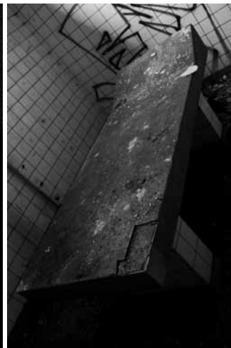
Můj mozek vyšle ještě několik zoufalých signálů než bude rozdrčen rohem konferenčního stolku