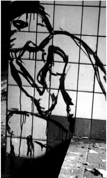
Až tehdy s vyhrzutými střevy si vzpomenu na tebe můj Bože