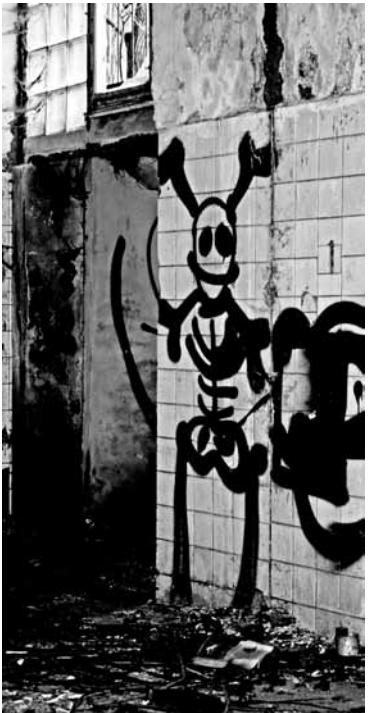
Někdy už chci nebejt