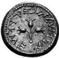
šekel z doby Judy Makabejského