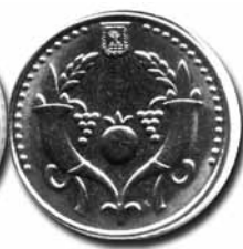
současný izraelský šekel