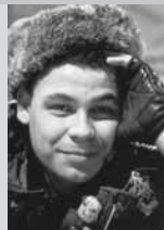
Lister, 3. technik kosmické lodi Červený trpaslík