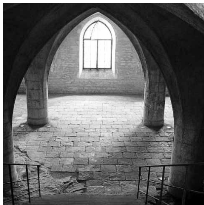
kaple Božího těla

udebních nástrojů (Mezinárodní hudební festival) i hlasy operních zpěváků (Operní týden), v září se sem slétají mladí básníci i fotografové (Ortenova Kutná Hora). V srpnu se zde zase potkávají amatérští divadelníci (Tyjátrfest) s ostřílenými rockery (Kutnohorský rockový festival). Nebojte se, památky nepropásnete, ty tam stále stojí, ale za noční oblohy, ve správné (a třeba lehce ovíněné) náladě nebo v ranní ospalé mlze vám bude Kutná Hora skýtat neobyčejné zážitky a zároveň zklidnění, které je k pro-