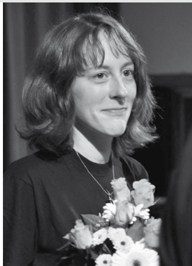
PŘEDSTÍRANÉ PŘEKVAPENÍ ?