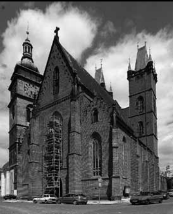
kostel sv. Ducha

zbytky opevnění i malebný dřevěný kostelík Sv. Mikuláše.