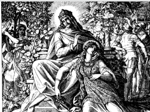
Píseň Šalamounova, zdroj web

Upřímná a pravdivá láska spojuje člověka s člověkem, proměňuje jejich životy a tvoří nové vztahy. ■