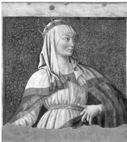
Ester, Galleria degli Uffizi, Florence, 1450

– půdu a krev – a skončili jako potrava pro plameny spaloven nacistických koncentračních táborů. U desítek a stovek křesťanů, kteří se odmítli na správné straně barikády zapojit do třídního boje a tak se ocitli na té druhé straně a na jejich hlavy dopadla ocelová pěst dělnické třídy. Je to jen shoda dat, ale právě v jarní době (ve které je onen 13. nisan) proběhly v tehdejší Československu největší komunistické zásahy proti řeholníkům. V březnu 1950 byla projednána „akce VŽK“, při které bylo později internováno na 10 000 řeholnic a 13. dubna byla v roce 1950 zahájena „akce K“, při které bylo do centralizačních klášterů převezeno téměř dva a půl tisíce mnichů. A přes veškerý ideologický nátlak jen málo řeholníků či řeholnic podleho a vystoupilo ze svých řádů.