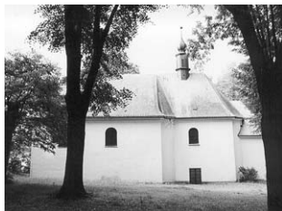
Kostel Božího těla

Kostelíček Božího těla, stojící nad obcí Bludov v podhůří Jeseníků, je moc zvláštní místo. Když slyším spojení „genius loci“, vybaví se mi právě Kostelíček. Ukrytý daleko od dědiny, na trase staré vozové cesty přes kopec, z bludovské strany obklopen hlubokými hvozdy. Luka z druhé strany otevírají severozá-