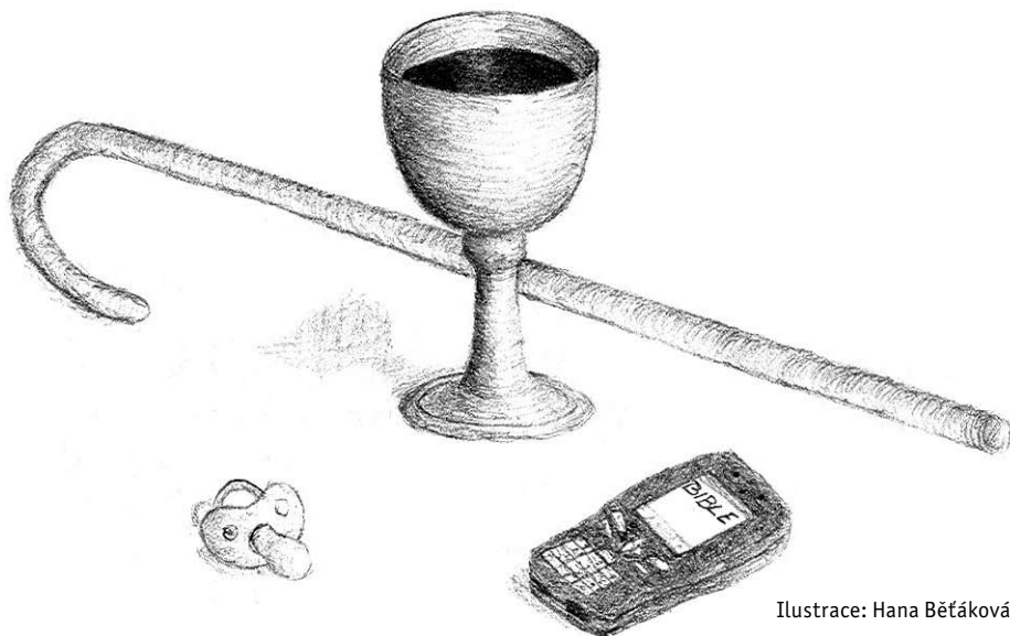
Ilustrace: Hana Běťáková

Před pár lety jsem v zahraničí potkala specialistku na život seniorů ve sboru. Navštěvuje kostely a sborové budovy a sleduje, jak vyhovují starším lidem a těm, kteří jsou nějak omezeni v pohybu nebo, jak říkají odborníci, jejichž smyslové vnímání je sníženo. Pečlivě sleduje co chybí a co by se dalo upravit. Pravda, církev si může dovolit hradit její mzdu a hlavně má prostředky na potřebné úpravy a vybavení - kvalitní zábradlí, vhodné židle, zesilovací zařízení, čitelné nápisy, madla, bezbariérový přístup, místo, kde se dá odložit hůl apod. Máme naději, že dnes už stavební fakulty i jiné školy vedou studenty k větší citlivosti k potřebám seniorů a lidí s postižením. Jistě existují i užitečné příklady, které nevyžadují stavební úpravy. Třeba jen dobře umístěná lavička před kostelem nebo vhodně rozmístěné židle, aby při Večeři Páně nemuseli všichni stát. Nenašel by se v církvi někdo, kdo