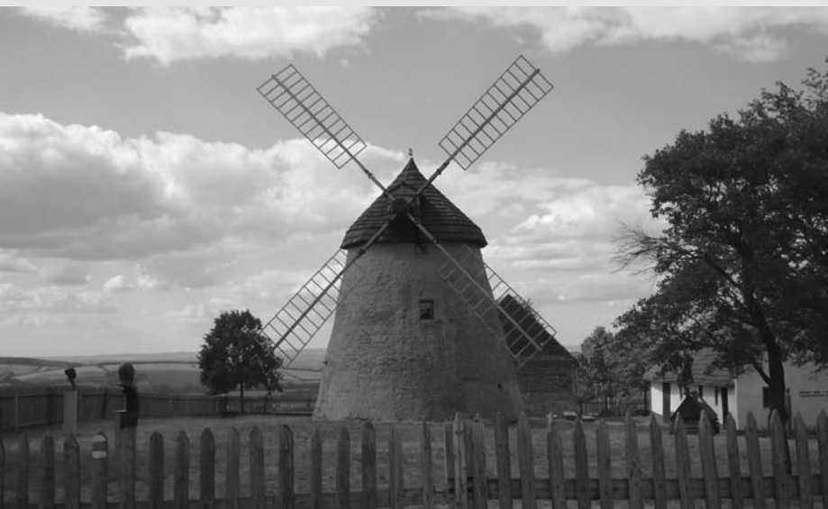
Větrný mlýn Kuželov

V krajině drsné a krásné, plné chráněných rostlin a nádherných přírodních zákoutí a kopců, v místech, kde je těžké sehnat práci a všude je odtamtud daleko, žijí dobří a srdeční lidé a pijí dobrou a silnou slivovici a víno lahodné chuti.