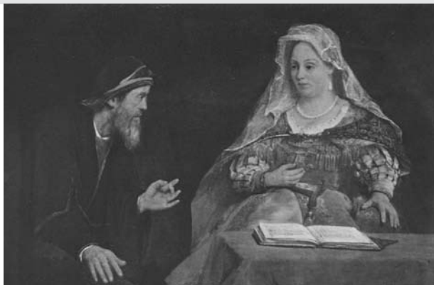
Aert de Gelder (1645-1727), Mordokaj a Ester

Ví to všechno moc dobře a proto s pláčem sedává u řek babylónských – Eufratu a Tigridu. Svou cítaru zavěsil na topol. Jen v duchu si propěvuje chrámové písně a ve vzpomínkách se vrací do Jeruzaléma, tak, jak ho znal z dob jeho největší slávy – když ještě stál Šalamounův chrám