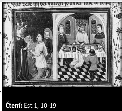
Čtení: Est 1, 10-19

Kominklijke Bibliotheek, Den Haag, 15. století