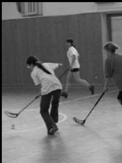
Brněnský seniorát – SOM CUP – Jaro 2007 Najdi pět rozdílů. Vyřešení na zadní straně obálky.