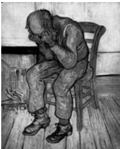
Old man in sorrow, Vincent van Gogh – trpěl depresí, spáchal sebevraždu v roce 1890, ve stejném roce namaloval tento obraz

Lidé, kteří depresí prošli, popisují svůj stav jako zoufalý, beznadějný, jako bolest duše, někdy říkají, že doba, kdy jim pláč přinesl úlevu, byla ještě dobrá.