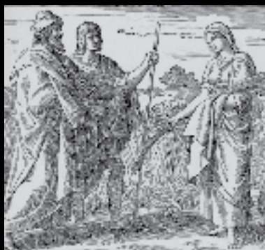
Čtení Rt 3

Ten dnešní příběh z knihy Rút je nejpodivnější část celé knihy. Když tak jeden nahlédne do komentářů jednotlivých vykladačů, tak přes všechny rozdíly neustále naráží na společnou myšlenku, kterou staří latiníci vyjadřovali úslovím Quod licet Iovi non licet bovi - co je dovoleno Jovovi, to není dovoleno volovi. Rút ano, ale ty, milý čtenáři, tohle dělat nesmíš. Jako by Rút patřila mezi určité vyvolence, pro které jako by prostě neplatila tradiční měřítko morálky, a tito vyvolení pak dělají věci, nad kterými nám, obyčejným smrtelníkům, zůstává rozum stát. Rút, která leze do postele Bóazovi, stojí v jedné řadě s Bóazovou praprapraprababičkou Támar, která se převlékla za prostitutku a vyspala se vlastním tchánem, či Lotovými dcerami, které v touze po potomku neváhaly opít vlastního otce a spát s ním. Ve stejné řadě ale stojí i mnohé výroky z žalmů a zvláště pak mnohé z toho, co Bohu řekl trpící Job. Gedeón, který se dožaduje několikánásobného znamení od Hospodina, než uvěří, že je to skutečně Boží slovo, aby šel proti Midjáncům. A nemusíme brouzdat jen vodami Starého zákona! Ježíš proklínající neplodný fíkovník, Ježíš vyhánějící kupčičky z krámu,