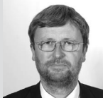
image pomůže uvědomit si, kým jsem a co vlastně o sobě chci říci těm druhým.