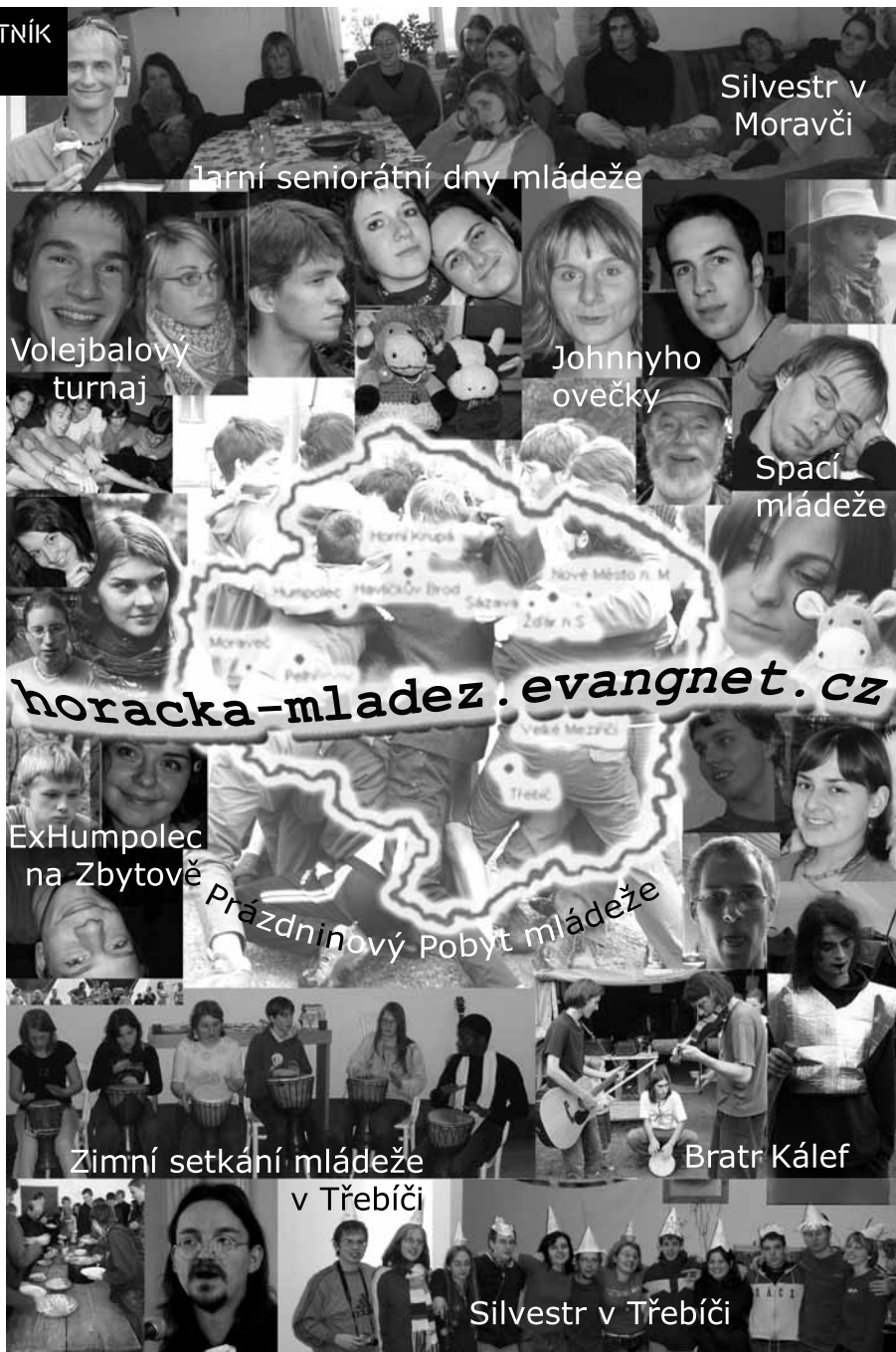
Silvestr v Moravči