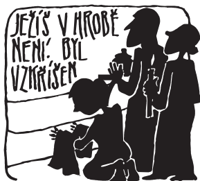
Ilustrace: Zdeněk Šorm

tě před svou smrtí obhajují ten, který bude vzkříšen. Obhajuje ji i za nás. Nedejte se zmýlit, živ je Ježíš! Ten, který „byl za nás ukřižován, za dnů Pontia Piláta byl umčen a pohřben, třetího dne vstal z mrtvých podle Písma“.