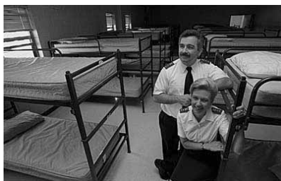
Ubytovna v New Hampsiřu

Nedělní bohoslužebné setkání Armády spásy se vyznačuje jednoduchou a přehlednou strukturou bez liturgie. Kdo by měl zájem o křest či eucharistii, toho kazatel odkáže na církev, která svátostmi umí posloužit. Příběh a mystérium života, smrti a vzříšení Ježíše Krista je základem zvěsti. Příklad Ježíšova života mezi učedníky má být inspirací a jeho konec a nový začátek všeho přináší naději. Pouze podle nenápadných důrazů se dá odhadnout, že kaplan mezi posluchači předpokládá lidi se specifickými problémy. Slova jako pokrm, domov, rodina... nabývají ambivalentního významu. Přesouváme se hromadně vedle, kde paní v bílé zástěře právě svinula roletu, aby mohla prvním ve frontě nalít polévku. Jídelna se plní lidmi. Hádejte, odkud jich přichází víc: zvenku, nebo odvedle?